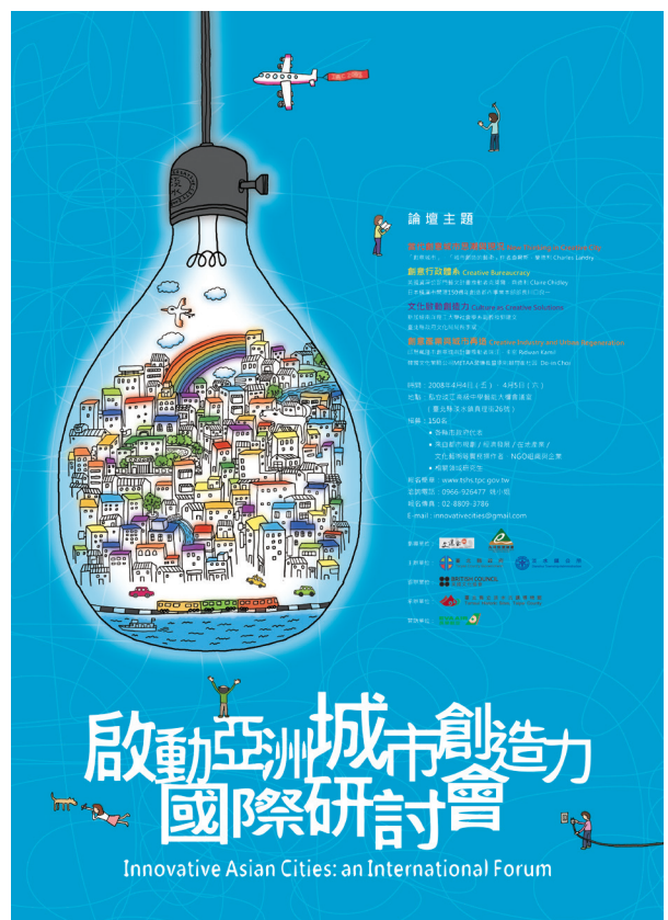
圖 2.1.1 「啟動亞洲城市創造力國際研討會」活動海報

再者，公部門如要自行辦理國際會議，因各人員有所職，英語能力又各有千秋，要鎮日接待所有國際專家學者抵台所有行程（每位國際專家學者至少 3 日行程，包含前 1 日抵台、活動當日與後 1 日離台），如僅靠業務承辦人員或其直屬主管接待照顧，實有困境。且人員較常調動，經驗承傳不易落實，常造成人力的斷層，也是公部門自行辦理國際會議的困境之一。本案感謝同在淡水的「竹圍工作室」同仁的大力支援與協助，才得以順利進行國際專家學者接待與聯繫相關作業。