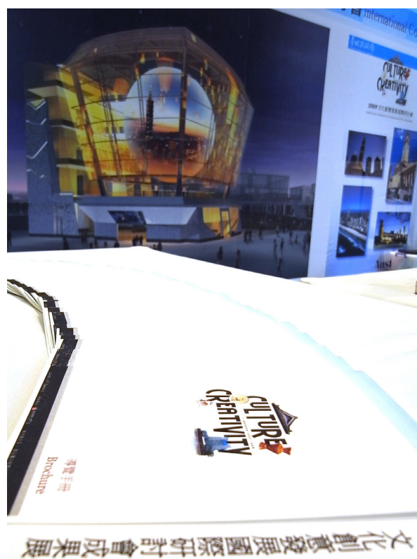
圖 3.1.4 「2009 文化創意產業發展國際研討會」國際文化創意成果展

(1) 98年10月20日~25日(共計5日),於臺北縣政府行政大樓1樓大廳,集結與會專家學者各自分享其成功案例之成果、作品,透過影片、書籍、模型、照片與文字說明等展示輔助,讓與會學員不僅可於「講堂式」的國際研討會課程學習他人經驗,更刺激在地設計產業向上提升。