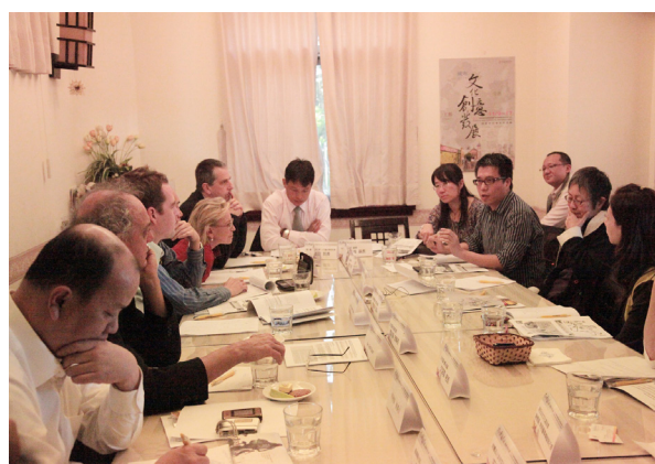
圖 3.1.5 「2010 文化創意產業發展國際研討會」淡水場工作坊會場