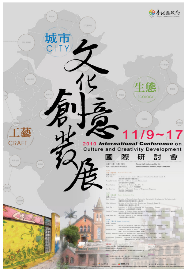
圖 2.2.2 「2010 文化創意產業發展國際研討會」活動海報