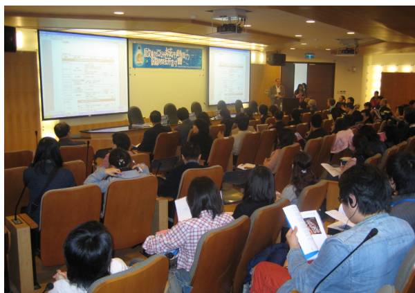
圖 3.1.2 「啟動亞洲城市創造力國際研討會」會議現場