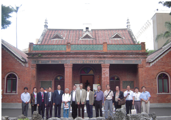
圖 3.1.3 「2009 文化創意發展國際研討會」國際學者參訪淡水古蹟群