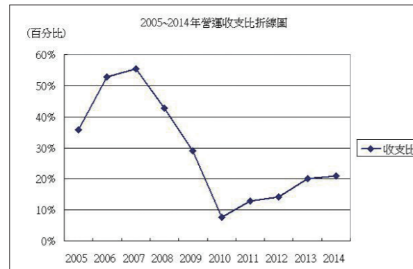
【圖 2】2005~2014 年營運收支比折線圖