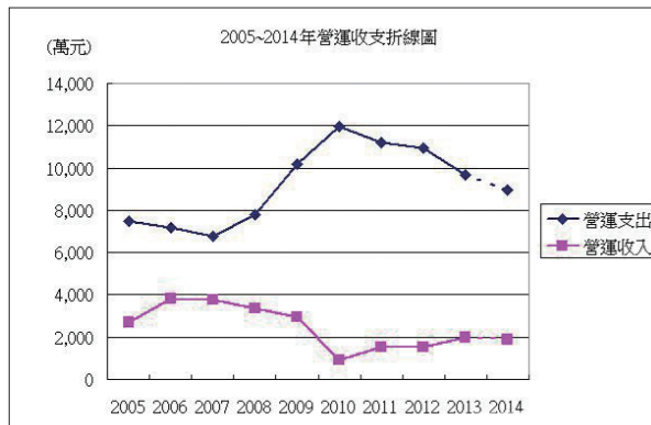
【圖 1】2005~2014 年營運收支折線圖 (虛線是概算)